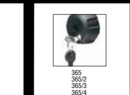
ART. 365 POMELLO ANTIFURTO SECURITY KNOB