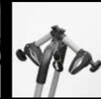
BRACCETTI PER 2ª BICI (ART. 706), PER 2ª e 3ª BICI (ART. 706/3 - 706/3A), PER 2ª, 3ª e 4ª BICI (ART. 706/4)