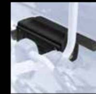
SISTEMA DI AGGANCIAMENTO E SGANCIO RAPIDO QUICK-RELEASE SYSTEM