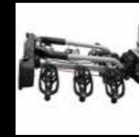
RICHIUDIBILE PER UN FACILE RIMESSAGGIO COMPLETELY CLOSE FOR EASY STORAGE