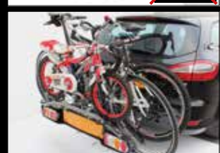
ART. 661 ACCESSORI PER BICI SUPPLEMENTARI SUPPLEMENTARY BIKE OPTIONAL