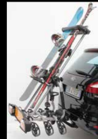
ART. 389 PORTA SCI/SNOWBOARD SKI/SNOWBOARD CARRIER