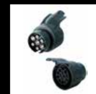
ART. 692 ADATTATORE SPINA 7 POLI + PRESA 13 POLI ADAPTER FROM 7-PIN PLUG TO 13-PIN