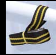
CINGHIA DI SICUREZZA SAFETY STRAP