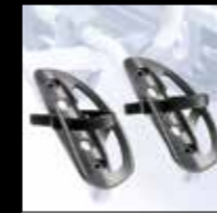
DETTAGLIO POGGIARUOTA WHEEL TRAY DETAILS