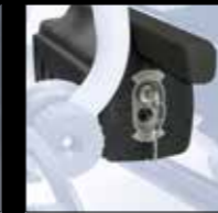
CHIUSURA A CHIAVE KEY LOCK SYSTEM